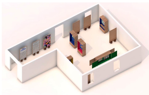
© Ahmad Reshad et Noé Rosticher - Pavillon Bosio, Art & Scénographie, école supérieure d'Arts Plastiques de la Ville de Monaco.

Vernissage de l'exposition : jeudi 13 novembre à 18h