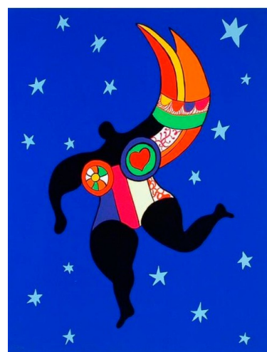
Mi-femme mi-ange 1992 Sérigraphie 65x50 cm MAMAC, Nice - Donation de l'artiste en 2001

L'itinérance du dispositif favorise l'accès à la culture et à la création dans une démarche pédagogique, sensible, collaborative et participative. Elle a pour vocation de susciter la rencontre directe avec l'art, les œuvres, le musée et ses équipes. Le dispositif permet aux enseignants d'être autonomes. Une formation enseignants présentant les modules et le matériel pédagogique mis à disposition est néanmoins recommandée pour faciliter la visite et l'exploitation de l'exposition ensuite.